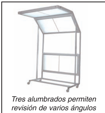
Tres alumbrados permiten revisión de varios ángulos

Sistema de inspección para la industria automotriz