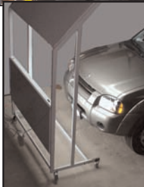
Ruedas facilitan el posicionamiento