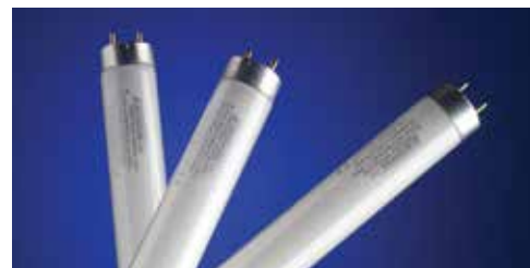
Fabricadas con una mezcla exclusiva de fosfatos fluorescentes para garantizar condiciones óptimas de revisar color, lámparas Graphiclite® 100 producen una luz blanca de espectro completo y brindan el más elevado grado de exactitud y eficiencia de la interpretación de colores.

GTI, compañía líder en sistemas de iluminación, es fabricante del sistema CHIS. Un laboratorio espectrorradiométrico dentro de sus instalaciones y un proceso de producción 100% controlado y verificado garantizan que todos los productos sean precisos y exactos, los que además se entregan con un certificado de conformidad de producto que cuenta con trazabilidad NIST (Instituto Nacional de Normas y Tecnología).