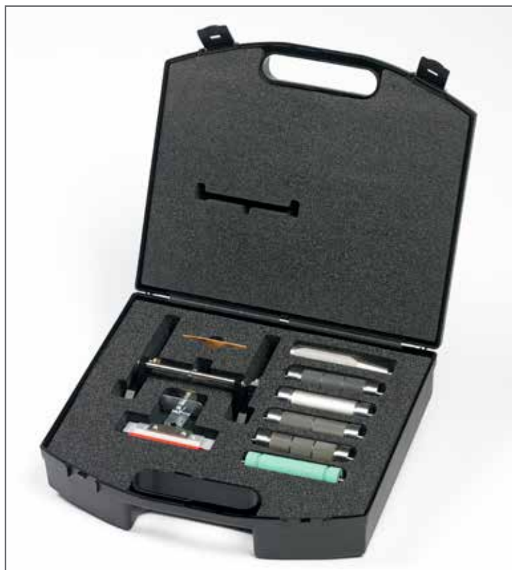
Esiproof en su maletín