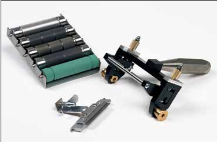
Esiproof con su juego de rodillos