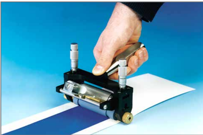
Versión original con micrómetro disponible