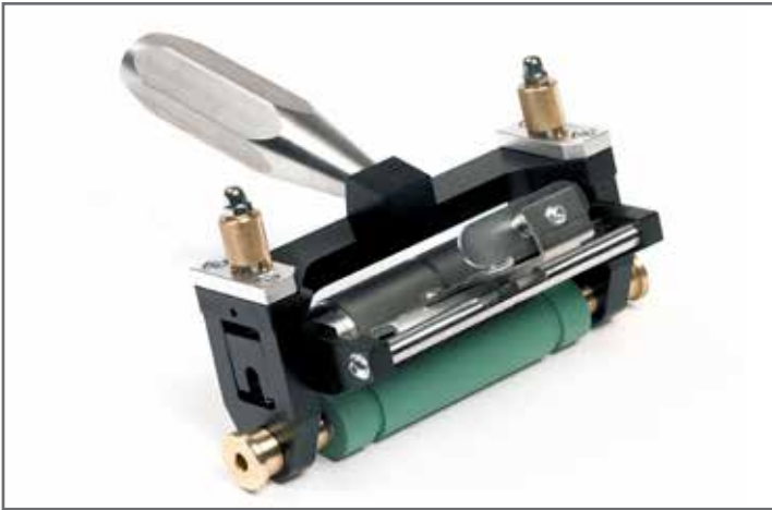
Versión con presión del resorte cargado